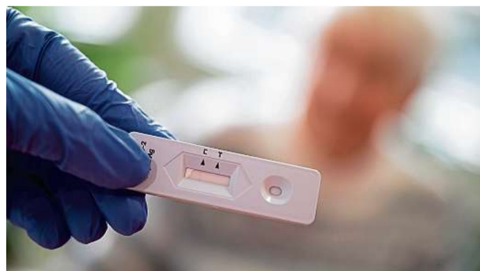
Positive Tests: In der Alten- und Pflegeeinrichtung Haus Hüttener Berge in Ascheffel sind 24 der 80 Bewohner infiziert. Ein Bewohner ist gestorben.

Laut Oldekop wird im Haus Hüttener Berge alle drei Tage flächendeckend getestet – sowohl Bewohner als auch Mitarbeiter. Der letzte Test hatte